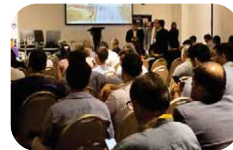
> Disponibilidad de salas para foros y eventos empresariales