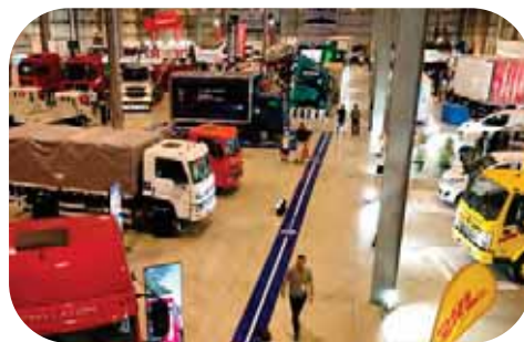
Pabellón de exposiciones de 5.600m 2 con muestra de vehículos

¡Siente la adrenalina al subirte a bordo de algunos de los modelos más destacados en nuestras pruebas de manejo exclusivas!