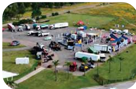
8.000 m 2 de explanada con productos y test drives