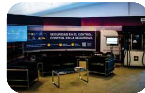
Pabellón de 6.000m 2 de empresas de productos y servicios